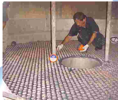
6. APLICACIÓN PARTE SUPERIOR CON BELZONA 1391