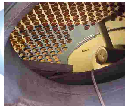
7. APLICACIÓN PARTE INFERIOR