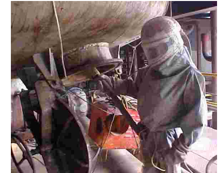
4. PREPARACIÓN DE SUPREFICIE