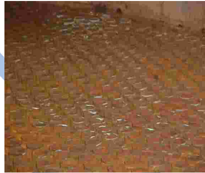
2. DAÑOS INTERNOS