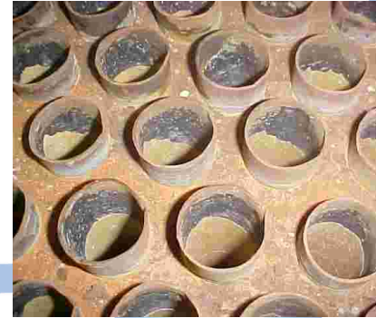
3. DAÑOS INTERNOS DE PARTE INFERIOR