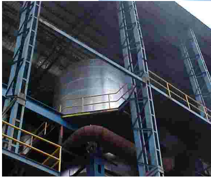
1. VISTA GENERAL