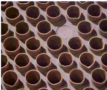
5. SUPERFICIE PREPARADA